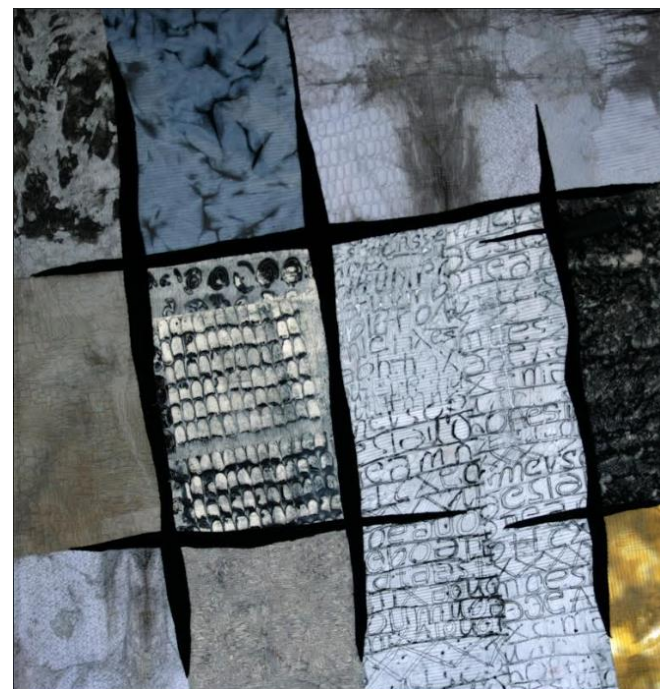
Jana Štěrbová, Mříže 2