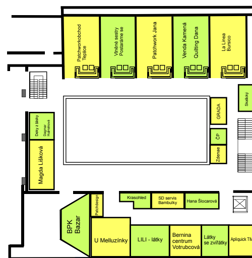
10. PRAGUE PATCHWORK MEETING Hala 2 - první patro