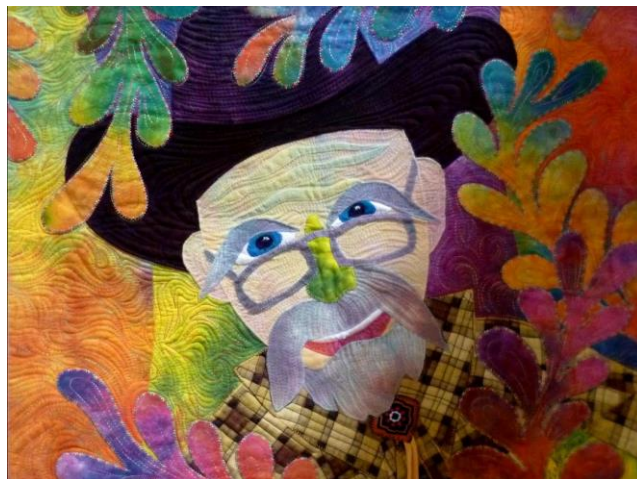
Ricky Tims, Autoportrét

Na setkání členů Patchwork Gilde Deutschland začátkem června v bavorském Fürthu jsme viděli premiéru celoněmecké výběrové kolekce „ Od tradice k moderně “, která bude PPM zapůjčena pro příští ročník. K zahraničním hostům patřil i u nás dobře známý Ricky Tims z USA. Všechny své české fanoušky pozdravuje a těší se na setkání na některé z dalších výstav PPM.