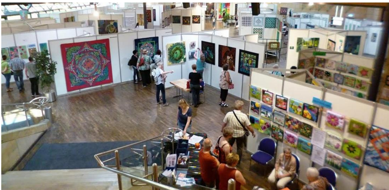
Patchwork Tage, Fürth