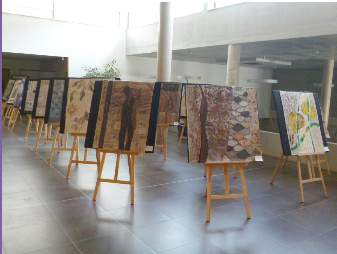
Výstava v Hlinsku